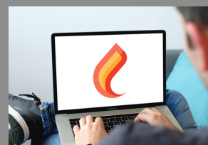
et bien plus ...