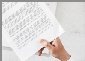
Règles du bon savoir-faire